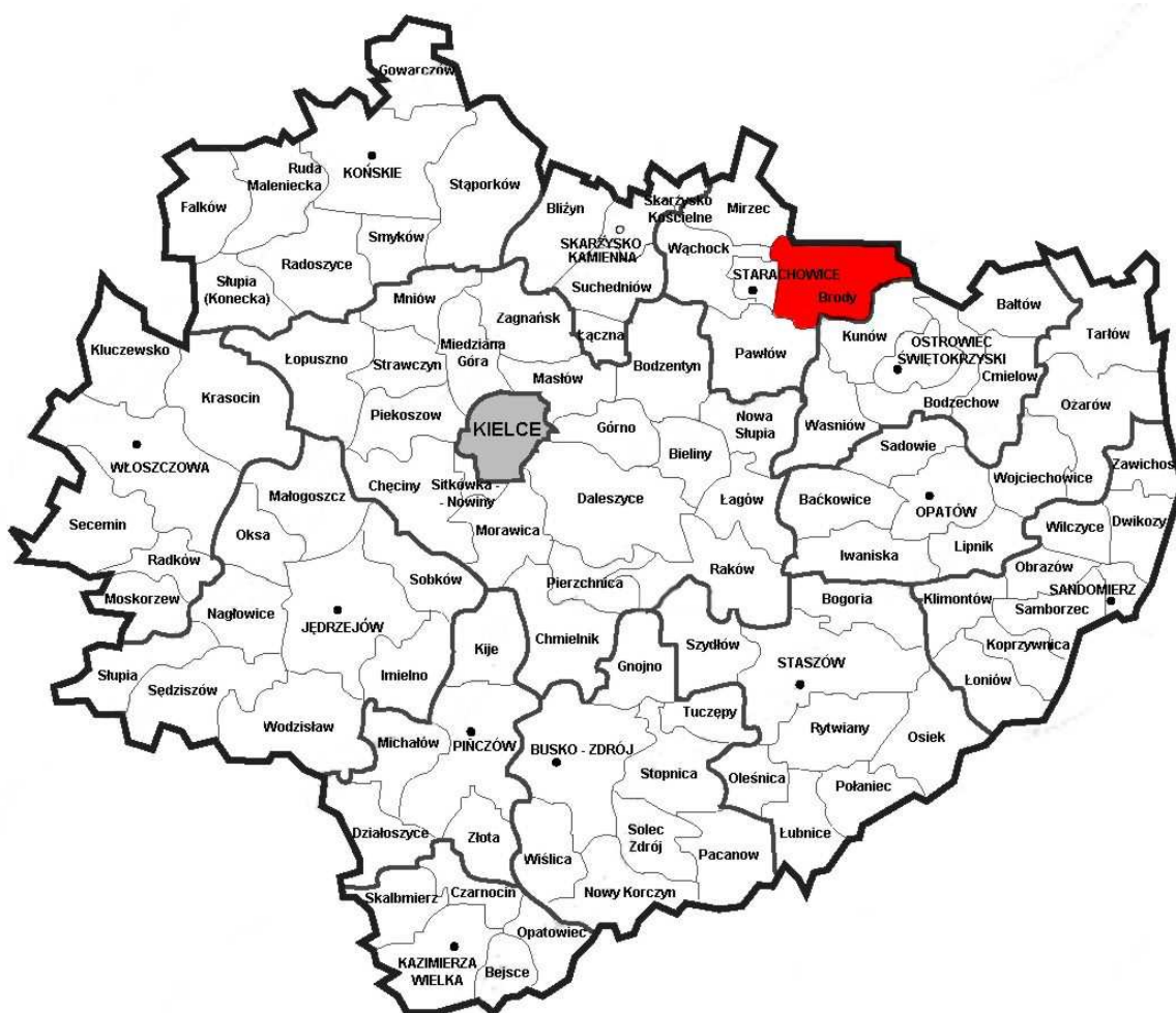
Mapa 2. Położenie Gminy Brody na tle Województwa Świętokrzyskiego