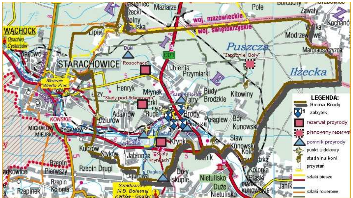
Mapa 3. Sołectwa Gminy Brody