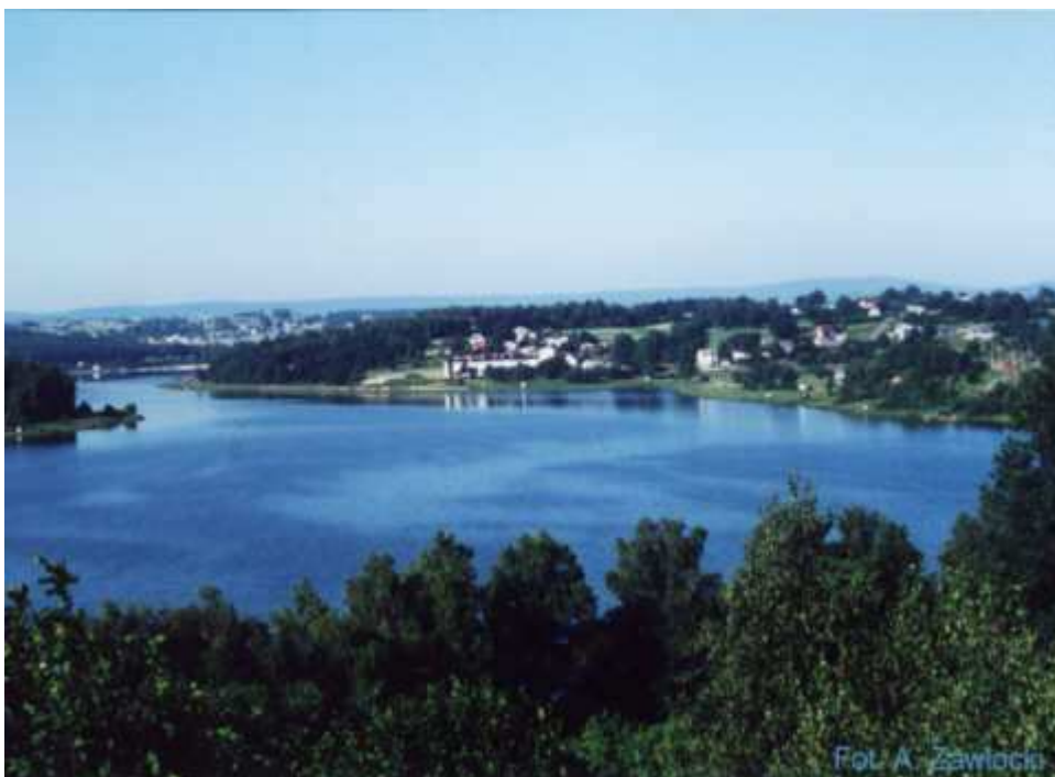
Fotografia 1. Zalew w Brodach