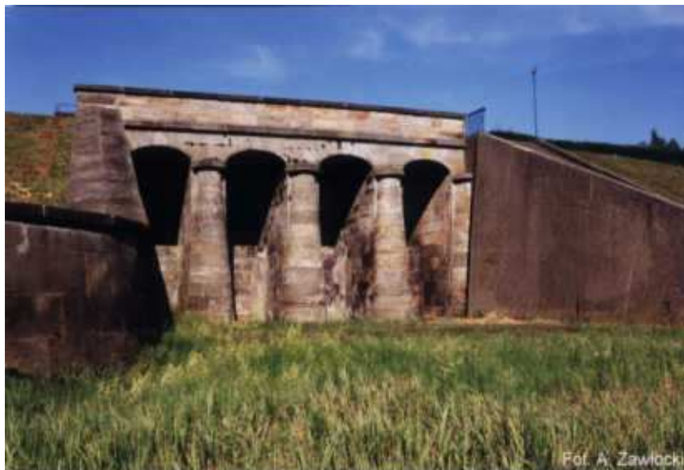
Fotografia 4 Kamienny przelew wodny w Brodach